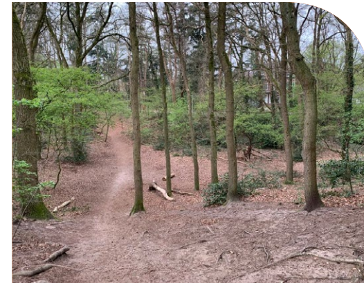
Eva van Rijen

Eva van Rijen is programmamaker bij Babel In de stad kan ook buiten zijn