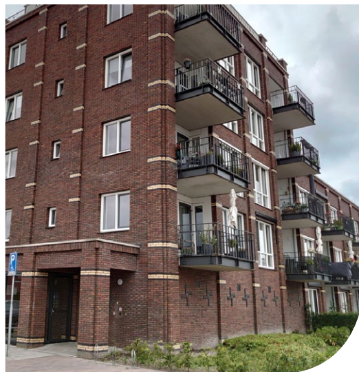
diverse woongebouwen in fase 3 in de Molenbuurt in Wormer (Attika architecten)