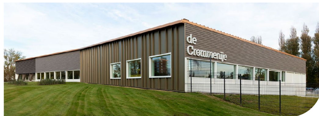
Zwembad De Crommenije in Krommenie (Slangen + Koenis architecten)