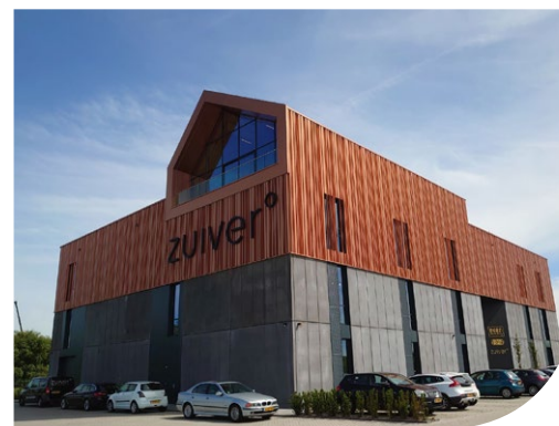
bedrijfsgebouw Zuiver in Westzaan (Nunc architecten)