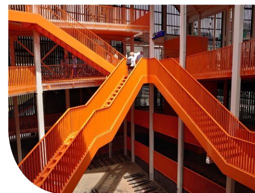
fietsenstalling De Droogschuur bij het NS-station in Zaanadam (Nunc Architecten)