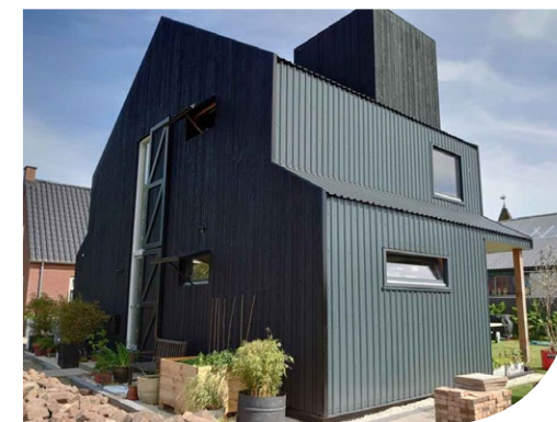
woonhuis aan het Zuideinde in Westzaan (Studio Kramer)