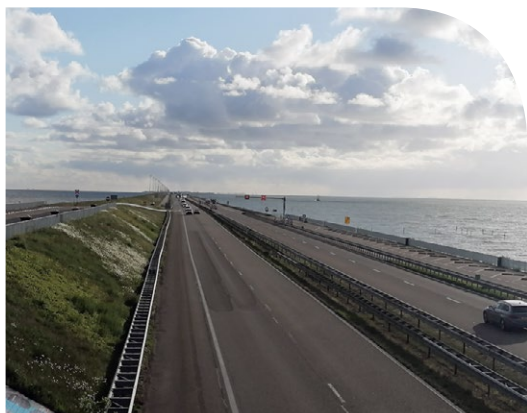
Leontine de Koning