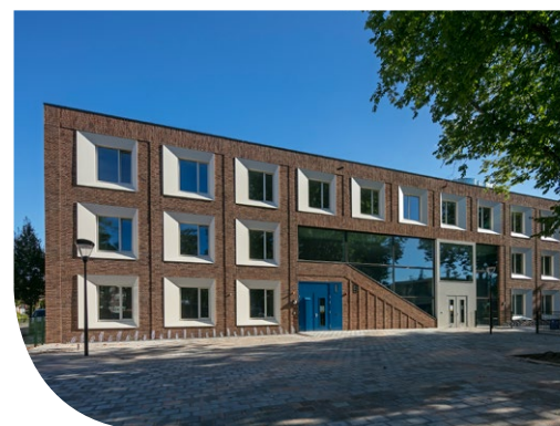
IKC Zaanplein (Nunc Architecten / Bald architecture)