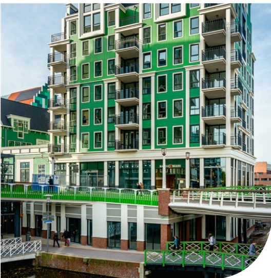
woongebouw Romanov (Boparai Associates architecten) in Zaanadam